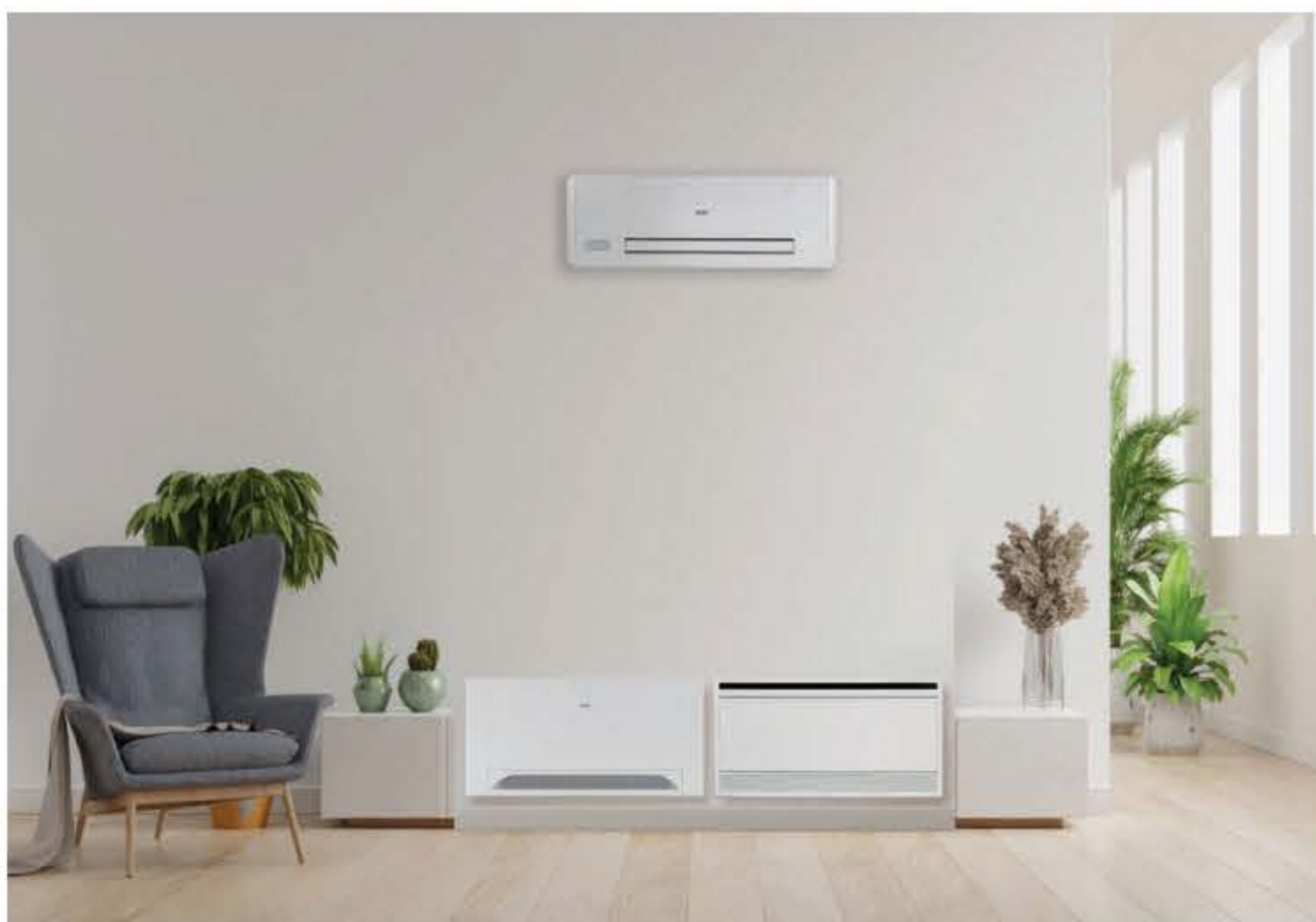
Στην εικόνα: Σειρά fan coil Baxi Wall και Baxi Floor για οικιακές εφαρμογές

Προσαρμόζεται πλήρως στις απαιτούμενες συνθήκες και μπορεί να συνεργαστεί με κάθε σύστημα θέρμανσης ή θέρμανσης / ψύξης ενώ με την προσθήκη boiler μπορεί να παράγει και Ζεστά Νερά Χρήσης.